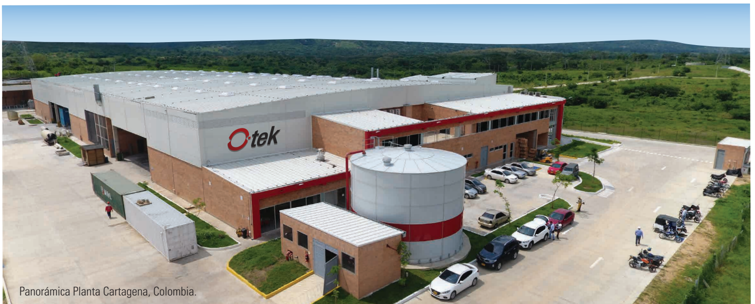
Panorámica Planta Cartagena, Colombia.